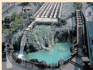
草津温泉 日本を代表する銘泉。温泉地中央の湯畑を中心に、古い風情の温泉街が広がっています。 国道18号線を軽井沢方面へ。鬼押ハイウェイから国道144号線、県道292号線を進む。(約100分)