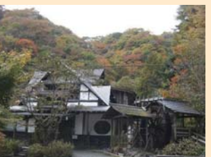
霧積温泉 西條八十の「帽子」がモチーフの『人間の証明』(森村誠一)の舞台として有名です。 国道18号線を軽井沢方面へ進み、碓氷峠旧道へ。(約25分)