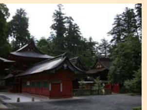
貫前神社 3代将軍徳川家光公の命によって建てられた、400年の歴史を持つお社です。 国道18号線を妙義方面に進み、県道51号線を富岡方面へ。八城交差点を右折し、北山交差点を左折。(約20分)